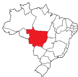
BRASIL – MATO GROSSO